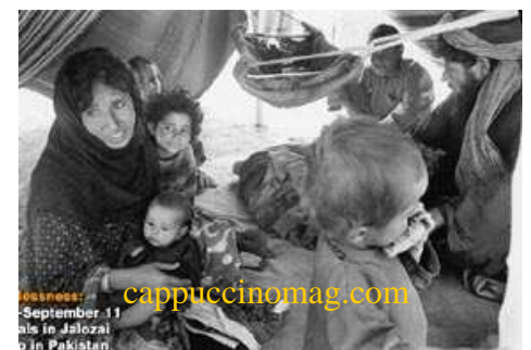
پناهجویان افغانی در پاکستان

بناء اگر خالهای کوچک، بد قواره و بی نظمی را در حاشیه های فراموش شده شهرهای مدرن و مجلل می بینید، نترسید، بروید داخلش و بعد می فهمید که این اشکال سیاه، توده عظیم از انسانهایی است که می توانست مثل تمام انسانهای دیگر پرطروات و زیبا باشد اما آنها فعلاً در دستگاه حقوق بشر به این شکل های بی شکل تبدیل شده. بروید آنها را در یابید. شاید فردا هیچ یک آنها دیگر آنجا نباشند. گیتوهای که در حاشیه شهرهای مدرن اروپا قرار دارد، شکل رشد یافته این هسته ها