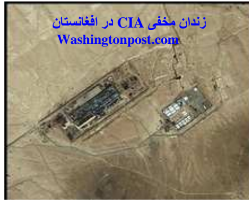
زندان مخفی CIA در افغانستان Washingtonpost.com